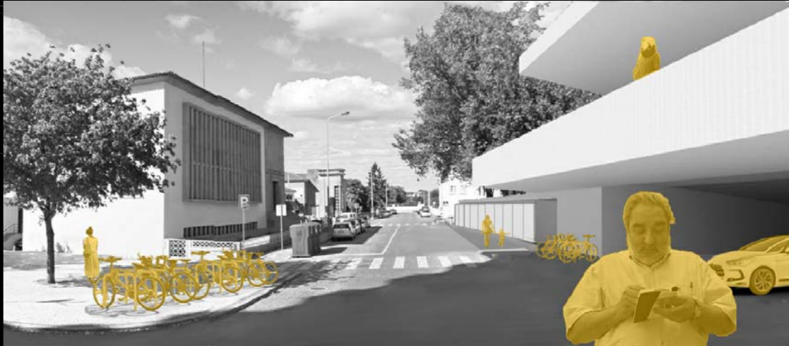
ALTERNATIVE MEANS OF TRANSPORT